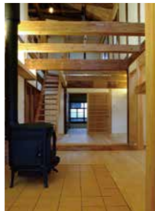
吹抜や高窓で明るい室内

冷房の無い時代に夏を過ごせるように作られた民家は、冬場は厳しいですね。風呂場や洗面所など家のなかで温度差がある場合はヒートショック(温度差による血圧の急変が引き起こす脳卒中や心臓麻痺)の原因になりかねません。民家再生では多くの場合、新たに断熱材を入れたり、高性能なサッシに交換するなどの方法で断熱性を向上させています。