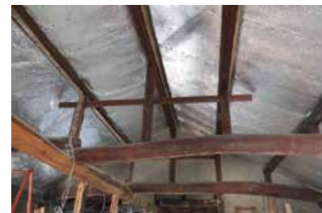
屋根裏に断熱材を入れて暖かく