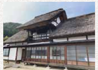
上条集落と「甲州民家情報館」